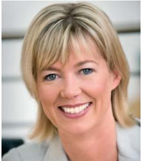
Дорис Анен Министр образования, науки, молодежи и культуры