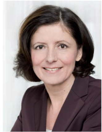
Malu Dreyer Ministerpräsidentin

Rheinland-Pfalz im Herzen Europas ist das europäischste der Bundesländer mit seinen Nachbarn Frankreich, Luxemburg und Belgien. In guter Nachbarschaft und zum Wohle der Menschen wollen wir daran mitwirken, dass die große Idee eines Europas des Friedens, der Freiheit, der Menschenrechte, der Demokratie und Toleranz auch in Zukunft überzeugt. Wir wollen ein besseres Europa. Wir setzen uns für eine soziale und nachhaltige Europäische Union mit regionaler Identität ein. Für ein Europa der Vielfalt und Bürgernähe, dafür stehen wir Regionen und Länder.