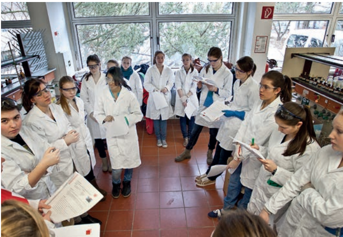
Schülerinnen des PAMINA-Gymnasiums Herxheim beim Workshop Chemie an der Universität Kaiserslautern.

Die bildungspolitischen Ziele der EU werden unterstützt.