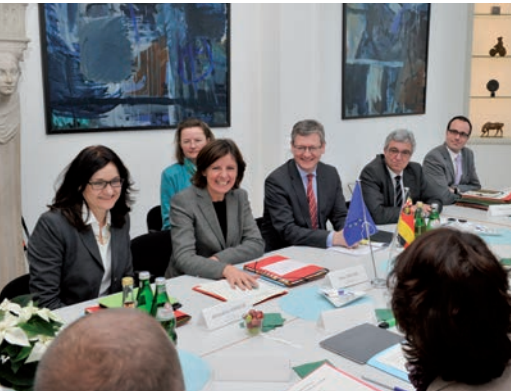
Sozialkommissar Lazio Andor am 25. November 2013 in Brüssel im Gespräch mit dem rheinland-pfälzischen Ministerrat.

Die historischen Erfahrungen, die die Europapolitik früherer Generationen geprägt haben, sind den Menschen heute weniger präsent. Wer Krieg, Hunger, Zerstörung und Ver-