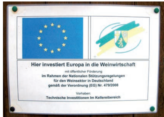
Schilder wie hier in Oppenheim weisen darauf hin, dass die Modernisierung von Weinbaubetrieben auch mit EU-Mitteln unterstützt wird.

Viele der markantesten Kulturlandschaften des Landes in Flusstälern und Steillagen wären ohne Weinberge nicht vorstellbar. Diese besonderen Kulturlandschaften können jedoch nur sinnvoll bewirtschaftet werden, wenn die Begrenzung der Pflanzrechte im Weinbau auf EU-Ebene auch über das Jahr 2015 hinaus fortgeführt wird. Die Landesregierung setzt sich daher dafür ein, dass die Anbaubeschränkungen restriktiv gehandhabt werden. Die Landesregierung unterstützt nicht nur im Sinne eines nachhaltigen Weinbaus gemeinsame und bessere Regelungen zum Schutz der Böden vor Erosion und Kontaminierung. Eine Bodenschutz-Richtlinie darf nicht weiter blockiert werden.