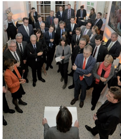
Die Vertretung des Landes in Brüssel ist ein Ort der Begegnung, der gerne genutzt wird.

Die Europastrategie soll es zudem den europainteressierten Rheinland-Pfälzerinnen und Rheinland-Pfälzern ermöglichen, sich besser über die rheinland-pfälzische Europapolitik zu informieren und sie ermutigen und befähigen bei europäischen Angelegenheiten mitzuwirken.