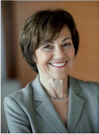
Margit Conrad Europaministerin

die Beschäftigung profitieren von dem gemeinsamen Markt und den offenen Grenzen. Aber die Menschen sollen Europa mit sozialem Fortschritt verbinden. Deswegen setzen wir uns für soziale Mindeststandards in Europa ein, aber auch für die Absicherung der kommunalen