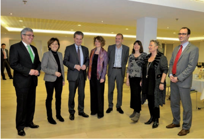
Mitglieder des Ministerrates im Gespräch mit Kommissar Günther Oettinger (3. von links) über die Ausgestaltung der europäischen Energiepolitik.

„Das Papier ist gut gemacht, stellt umfassend die Beziehungen von Rheinland-Pfalz zu Europa dar und ist an Projekten orientiert, Projekten mit der Nachbarschaft, Regionalprojekten, an den Programmen, die man von der EU-Kommission und dem europäischen Haushalt abrufen kann. Ich wünsche mir, dass alle Regionen in Europa so konkret ihre Beziehungen zu der EU definieren.“