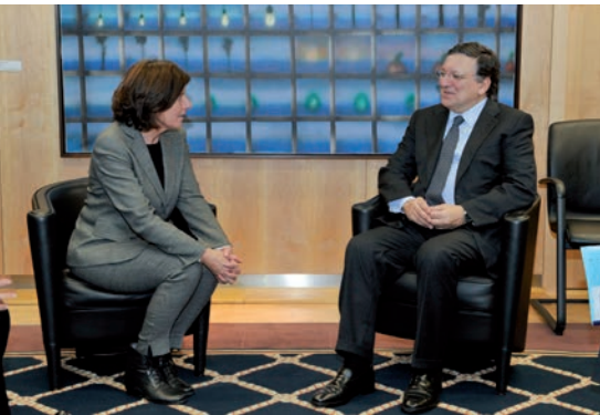
Die Überwindung der Finanz- und Wirtschaftskrise war neben anderem Thema des Gesprächs von Ministerpräsidentin Dreyer mit Kommissionspräsident Manuel Barroso am 25. November 2013 in Brüssel.

zuerlangen, haben die Euro-Staaten auf der Grundlage von zwischenstaatlichen Verträgen weit reichende Beschlüsse gefasst: Zunächst die Errichtung eines zeitlich begrenzten Euro-Rettungsschirms, dann – nachdem erkennbar wurde, dass dieses Hilfsinstrument zur Lösung der Krise nicht ausreichte – den dauerhaften Europäischen Stabilitätsmechanismus (ESM). Schließlich wurde der „Fiskalpakt“ vereinbart, der als wesentliche Elemente die Verpflichtung auf eine strikte Stabilitätspolitik sowie eine rechtlich verbindliche Verschuldungsbremse enthält. Auch die Länder sind davon in sehr direkter Weise betroffen.