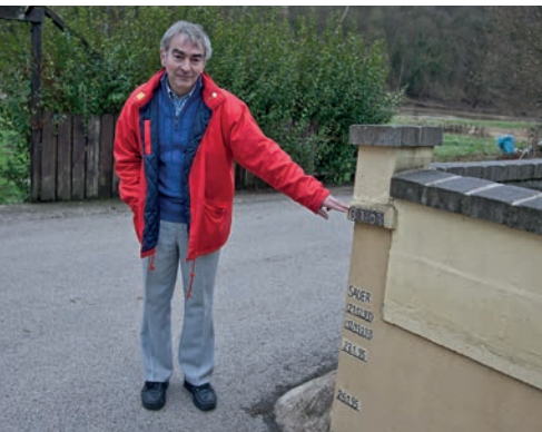
Der Hochwasserstand der Sauer im Januar 2003. Heute Schnee von gestern.

In der EU hat man sich früh auf gemeinsame Zielsetzungen zur Reinhaltung von Flüssen und Seen geeinigt und große Erfolge erzielt, das zeigt z.B. die jährliche europäische Badegewässer-Übersicht der Kommission. Rheinland-Pfalz kann sich auf eine jahrzehntelange Zusammenarbeit mit seinen Nachbarn Niederlande, Frankreich, Belgien und Luxemburg in internationalen Flussgebietsgemeinschaften zum Schutze des Rheins, der Mosel und der Saar stützen. Über die Entwicklung von Konzepten zu grenzüberschreitenden Flusslandschaften, den Ausbau grenzübergreifender Abwasserbehandlungs- und Wasserversorgungseinrichtungen bis hin zu grenzüberschreitenden kommunalen Hochwasserschutz-Partnerschaften sollen - möglichst mit Unterstützung der EU - kooperative Ansätze die Gewässerbewirtschaftung und den Hochwasserschutz in Rheinland-Pfalz weiter verbessern helfen.