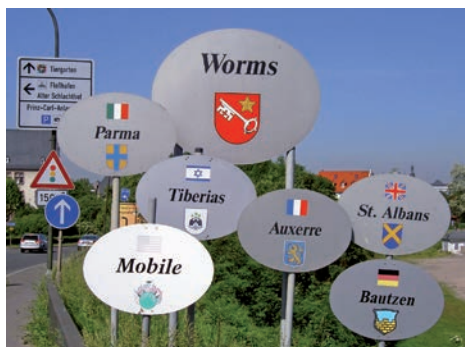
In Rheinland-Pfalz gibt es 469 Partnerschaften von Städten und Gemeinden, davon 263 mit Frankreich und 40 mit Polen.

Wir wollen ein kommunalfreundliches Europa. Eine Umsetzung der unterschiedlichen EU-Politiken, sei es nun im Bereich der Wirtschafts-, der Umwelt- oder auch der Strukturpolitik, ist in Deutschland und Rheinland-Pfalz ohne die enge Zusammenarbeit mit den Kommunen nicht denkbar. Wir greifen die Anliegen der Kommunen insbesondere im Bereich der Daseinsvorsorge und bei der öffentlichen Infrastruktur auf. Wir wollen die Zusammenarbeit mit den Kommunen und den Kommunalen Spitzenverbänden zu europapolitischen Fragen verstärken und sie beim Zugriff auf die EU-Förderprogramme unterstützen.