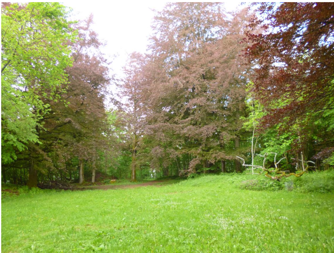
Abb. 9: Plateau auf der Kuppe des Arembergs (SGD Nord)