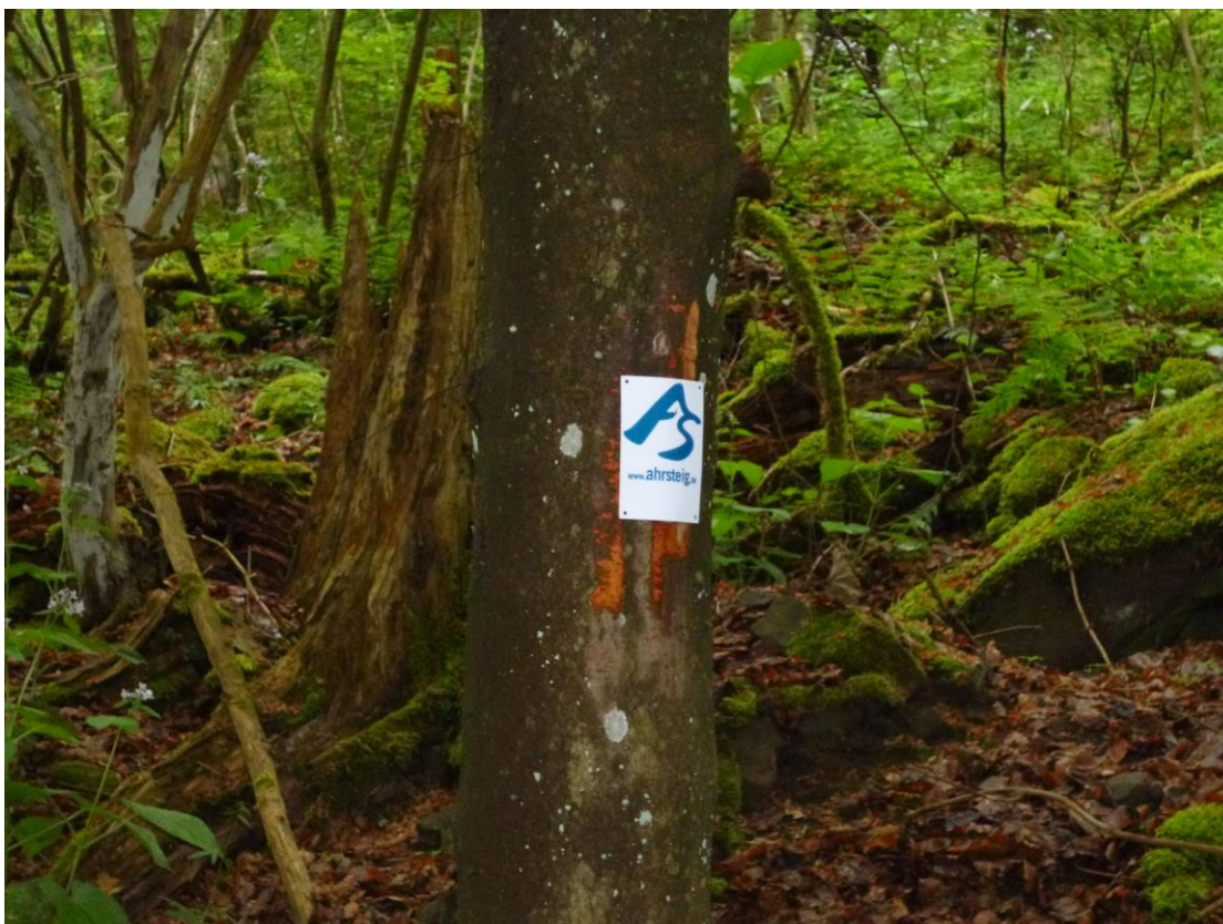
Abb. 6: Wegweiser des Ahrsteigs, der über den Aremberg durch das FFH-Gebiet führt