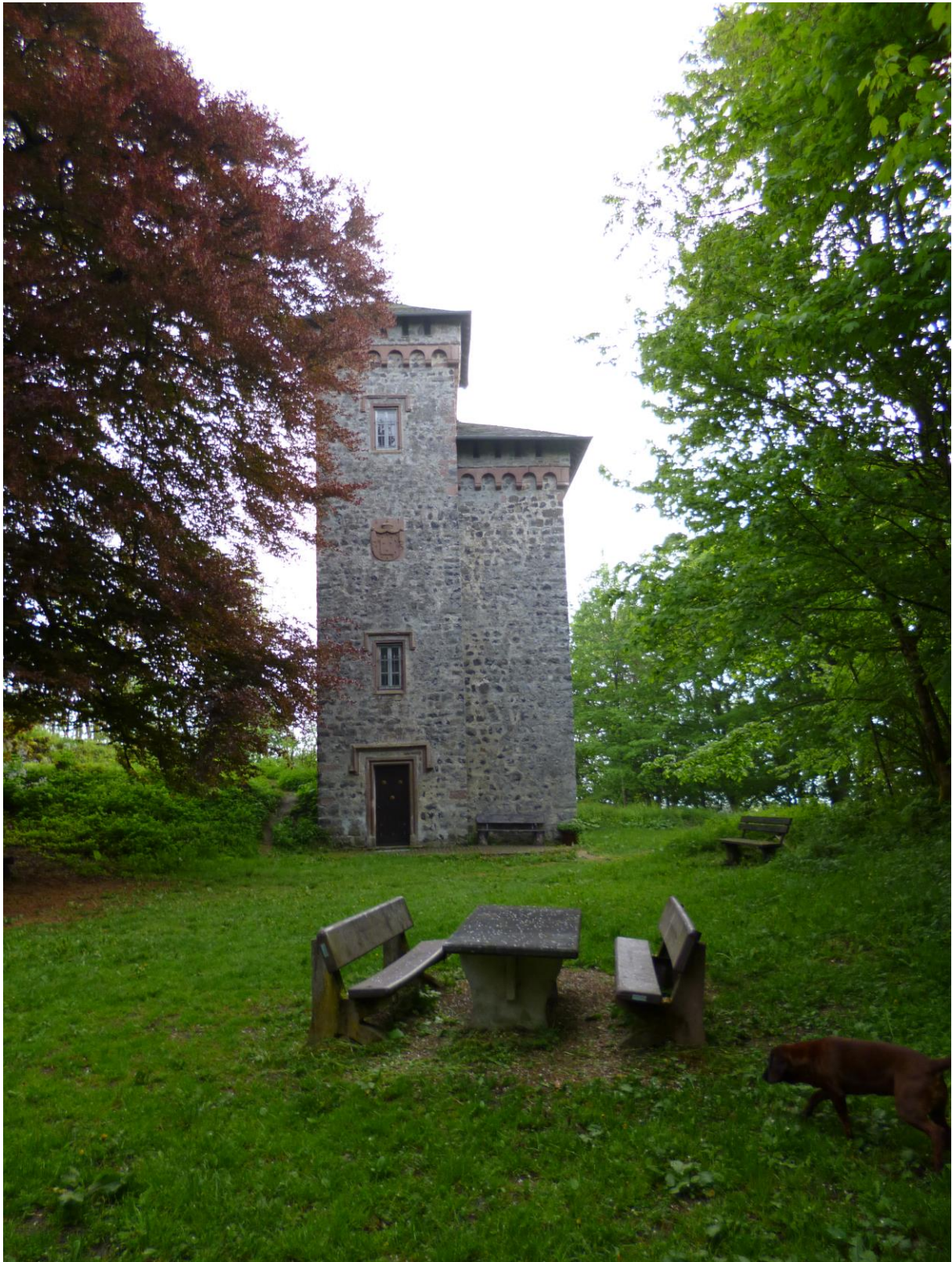
Abb. 11: Aussichtsturm auf dem Aremberg (SGD Nord)