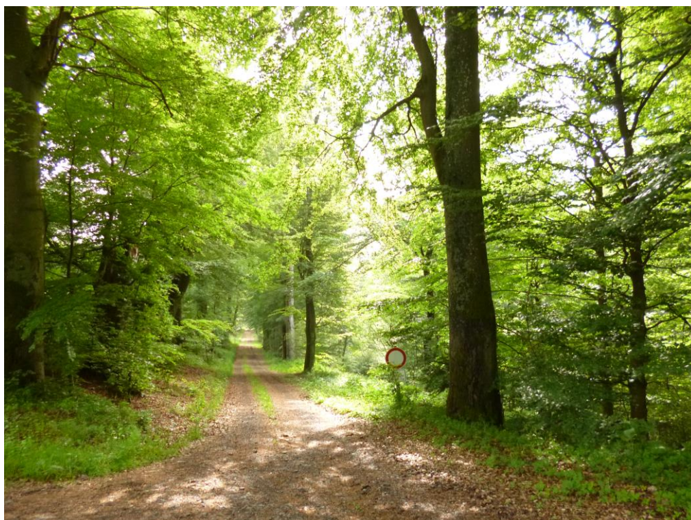
Abb. 2: Waldmeister-Buchenwald (FFH-LRT 9130) und Buchenallee an der Grenze des FFH- und des Naturschutzgebietes südöstlich von Eichenbach (SGD Nord)