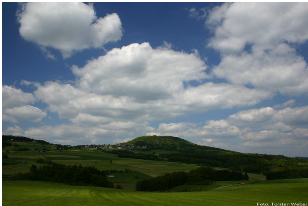
Abb. 1: Blick auf den Aremberg (Gebietssteckbrief, LfU http://www.naturschutz.rlp.de/?q=node/399 )