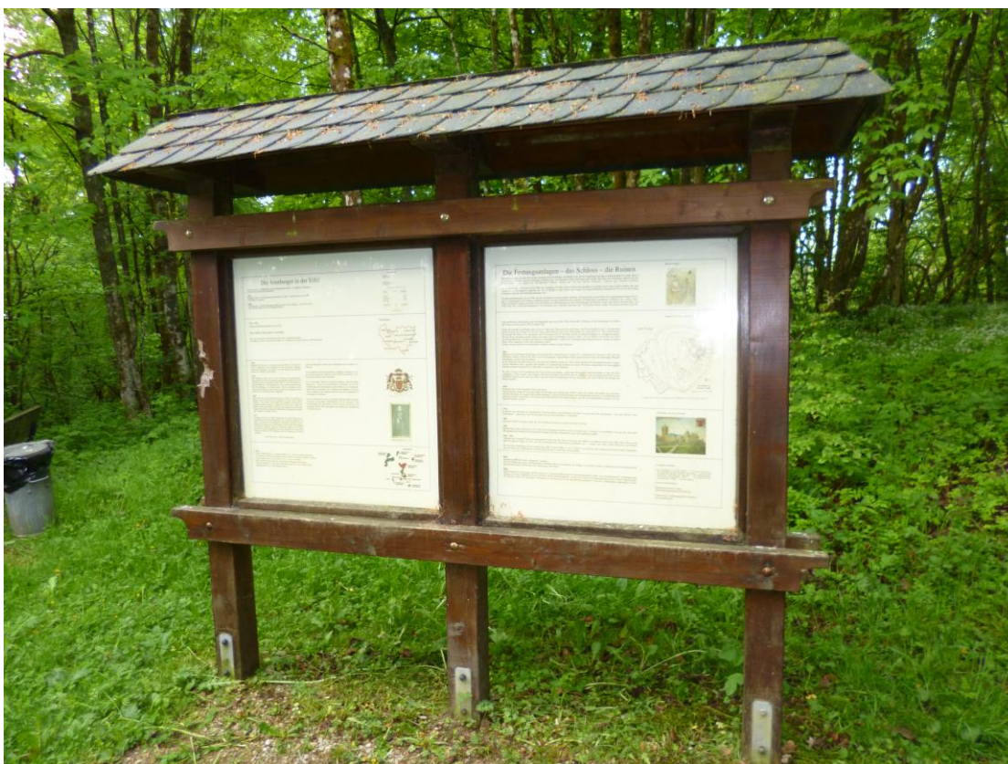
Abb. 10: Hinweistafel zum Herzogtum Arenberg, zu den Festungsanlagen, dem Schloss und den Ruinen auf dem Aremberg (SGD Nord)