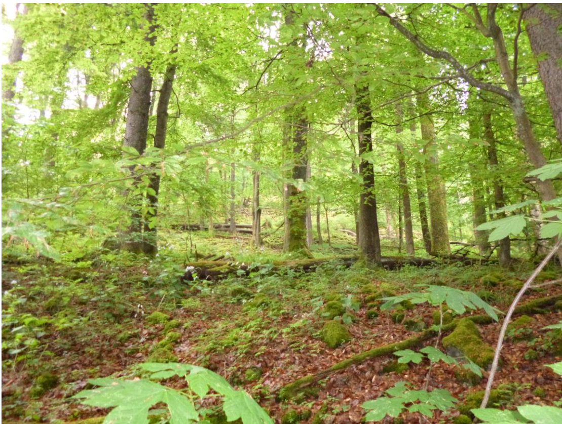
Abb. 8: Schlucht- und Hangmischwald (FFH-LRT 9180), Waldrefugium, nördlich der Kuppe des Arembergs (SGD Nord)