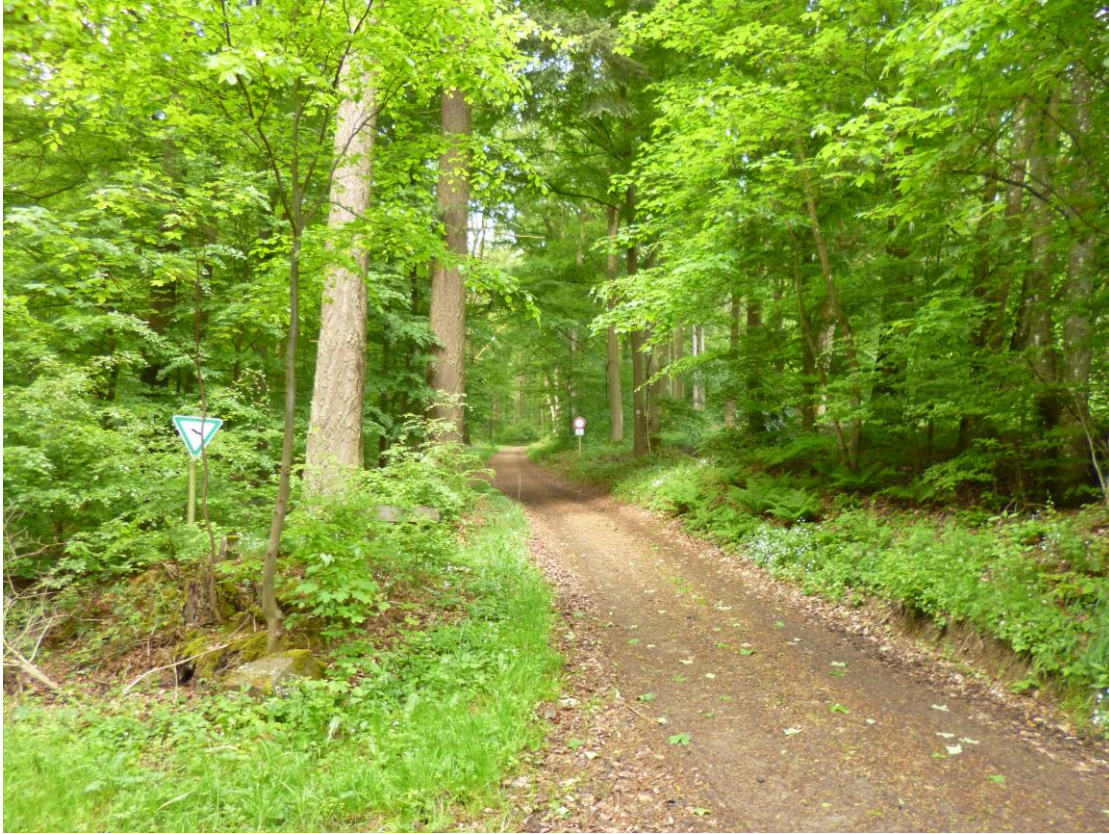
Abb. 3: Waldmeister-Buchenwald (FFH-LRT 9130) an der Grenze des FFH- und des Naturschutzgebietes südöstlich von Eichenbach (SGD Nord)