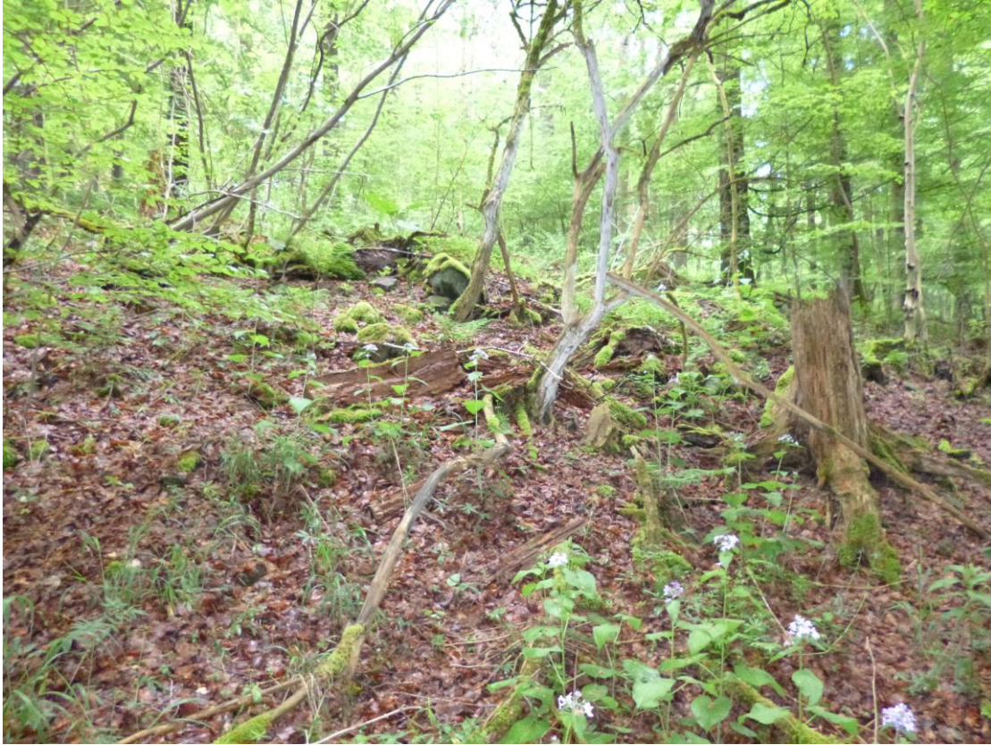
Abb. 7: Schlucht- und Hangmischwald (FFH-LRT 9180), Waldrefugium, nördlich der Kuppe des Arembergs (SGD Nord)