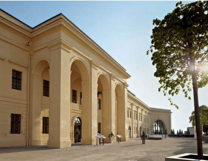
Das Kulturzentrum Festung Ehrenbreitstein | Landesmuseum Koblenz zeigt in vier Ausstellungshäusern eine Million Jahre Kulturgeschichte.