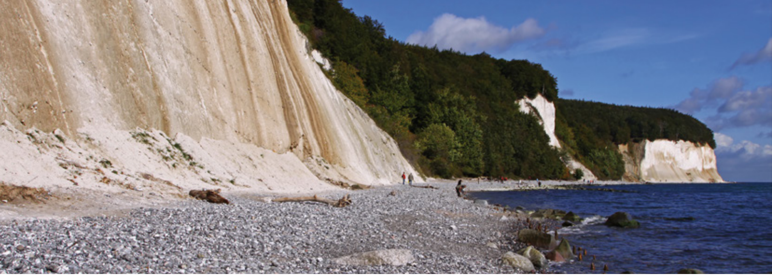
Kreidefelsen auf Rügen