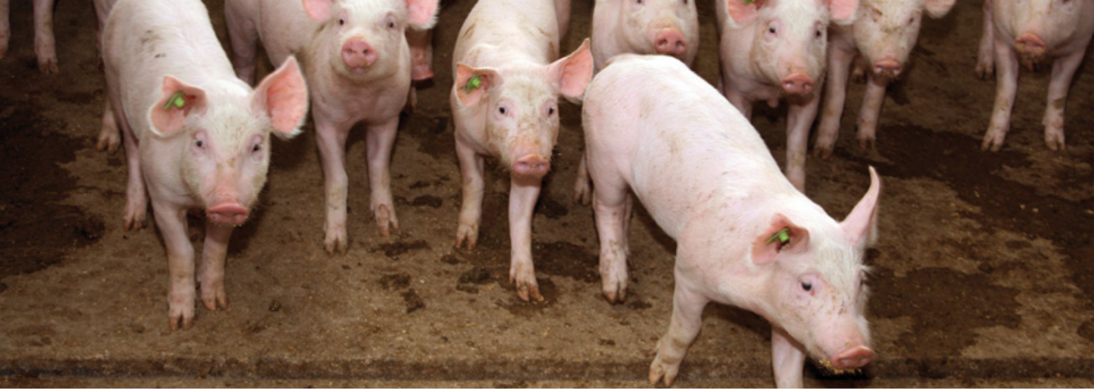
Schweinezuchtbetrieb in Thüringen

Spätestens dann, wenn die Gesundheit von Mensch, Gesellschaft und Landschaft in diesem Ideal zusammengeführt werden, ist diese Auffassung kritisch zu hinterfragen.