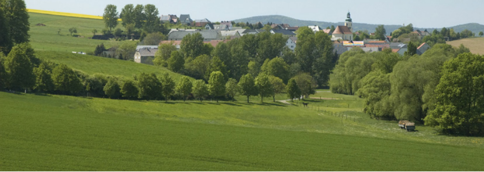
Landschaft im Osten Deutschlands

wirtschaft ausgerichtet, die sich bis zum Zweiten Weltkrieg (1939–1945) zu einer Kriegswirtschaft entwickelte. 31