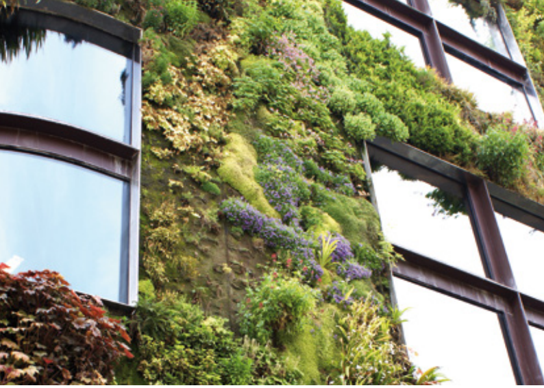
Begrünte Wand als Wärmedämmung