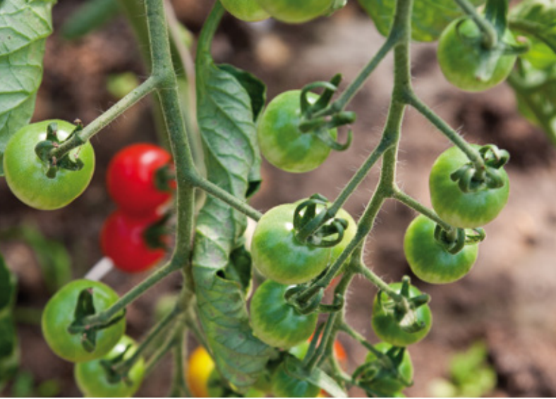
Tomatenpflanze, ursprünglich aus Mittel- und Südamerika