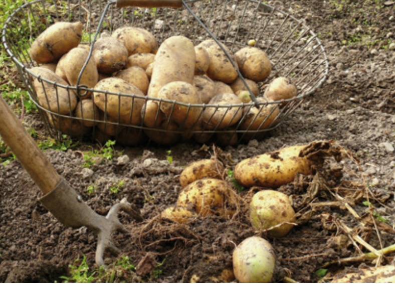
Kartoffeln, ursprünglich aus Südamerika