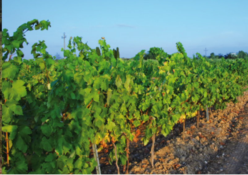
Weinbau in Spanien