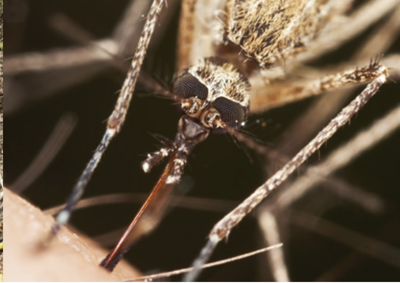
Malaria- oder Anophelesmücke, mittlerweile auf allen Kontinenten zuhause

Naturschutzargumente, die auf die Erhaltung der heimatischen Tier- und Pflanzenwelt, der Landschaft und Heimat zielen, aus diesen Gründen auf. Naturschutzakteur*innen befinden sich nun plötzlich ungewollt in Übereinstimmung mit Programmpunkten rechtsextremer Parteien. Die unwissenschaftliche Auseinandersetzung mit der Neophyten-Thematik birgt die Gefahr in sich, bewusst oder unbewusst fremdenfeindliche Denkmuster widerzuspiegeln und Naturschutzargumente selbst in den Sog entsprechender biologistischer Einstellungen zu bringen.