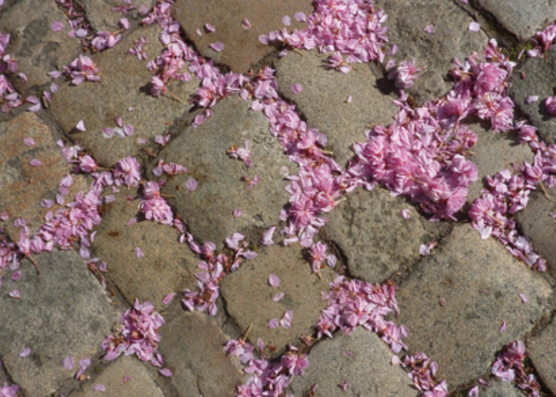
Kirschblüten in Berlin