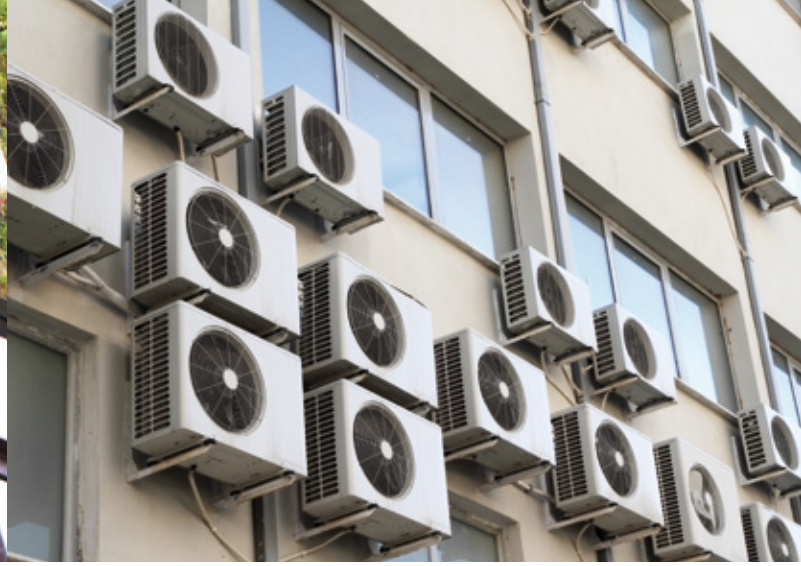
Klimaanlagen an einem Bürohaus