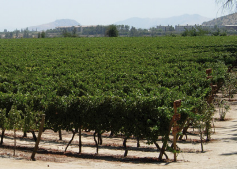
Weinbau in Chile