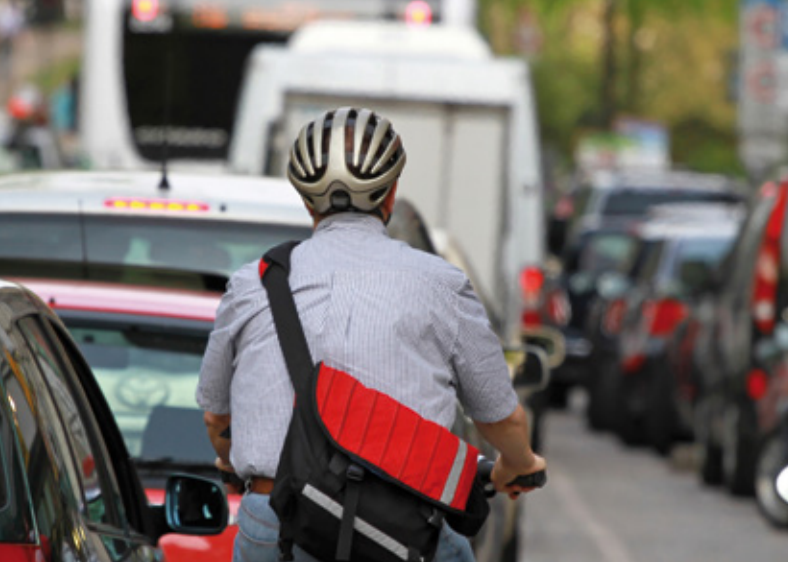
Rush-Hour in der Großstadt