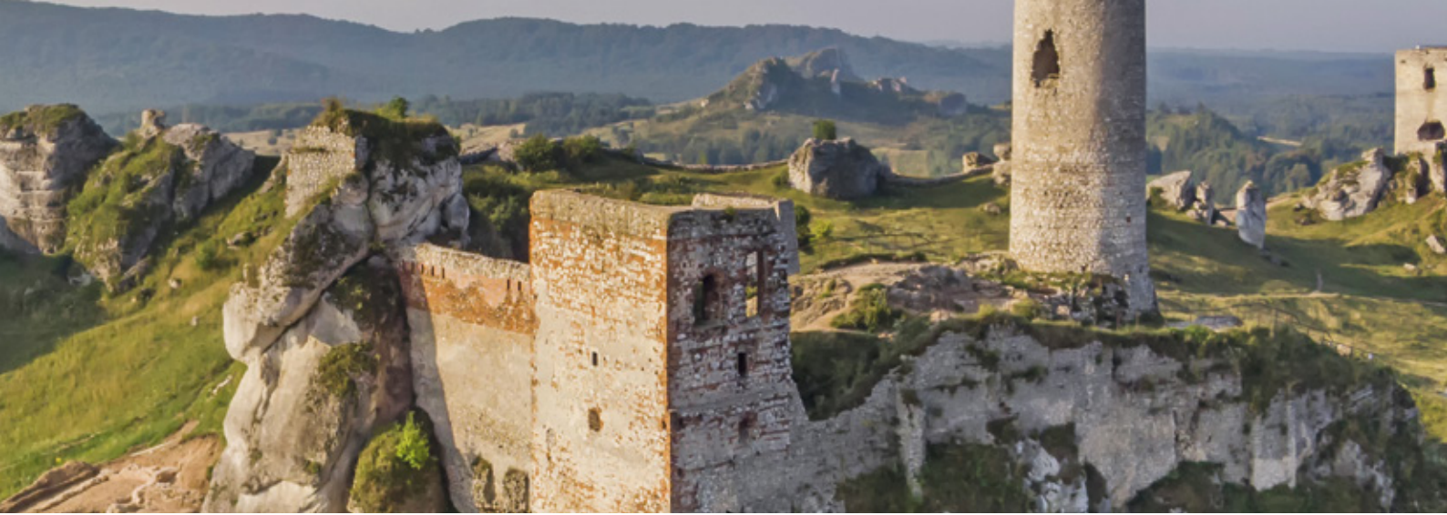
Olsztyn Burghügel in Polen