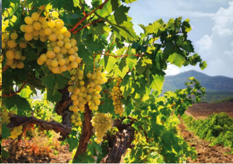
Weinbau in Italien

Geht man von diesem deutlich klareren Verständnis von Kulturlandschaft aus, so ist es folgerichtig, dass auch andere Gesellschaften ihre Landschaft prägen. Auch sie verfügen über eine Kulturlandschaft. Nicht nur deutsche, sondern auch russische, französische, US-amerikanische Landschaften sind selbstverständlich Kulturlandschaften.