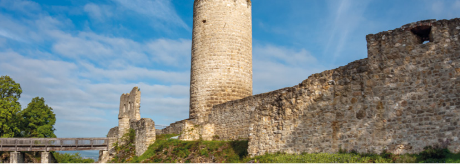
Burgruine Wolfstein bei Neumarkt Bayern