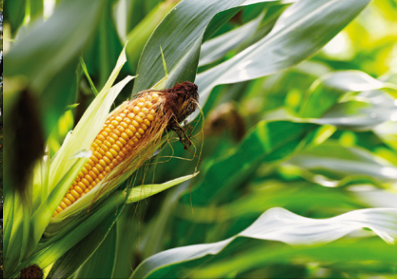
Mais, ursprünglich aus Mexiko