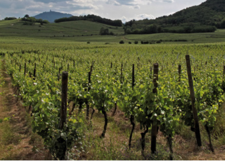
Weinbau in Frankreich