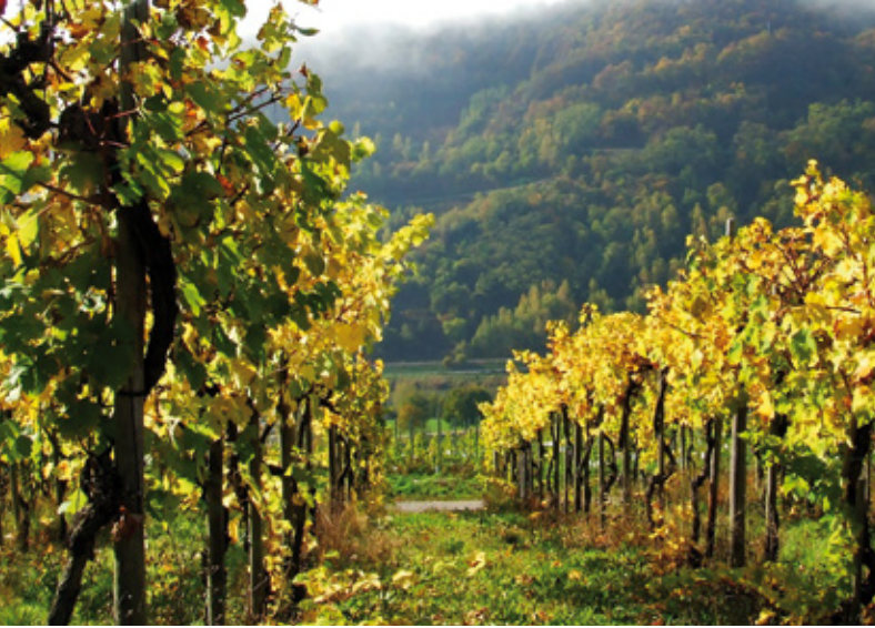
Weinbau in Deutschland