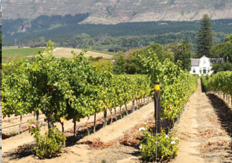
Weinbau in Südafrika