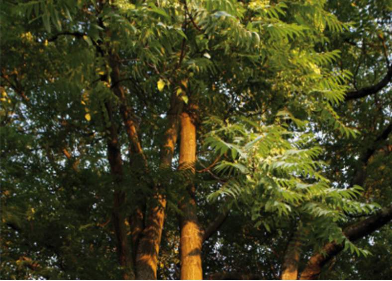
Götterbaum, ursprünglich aus China und dem nördlichen Vietnam