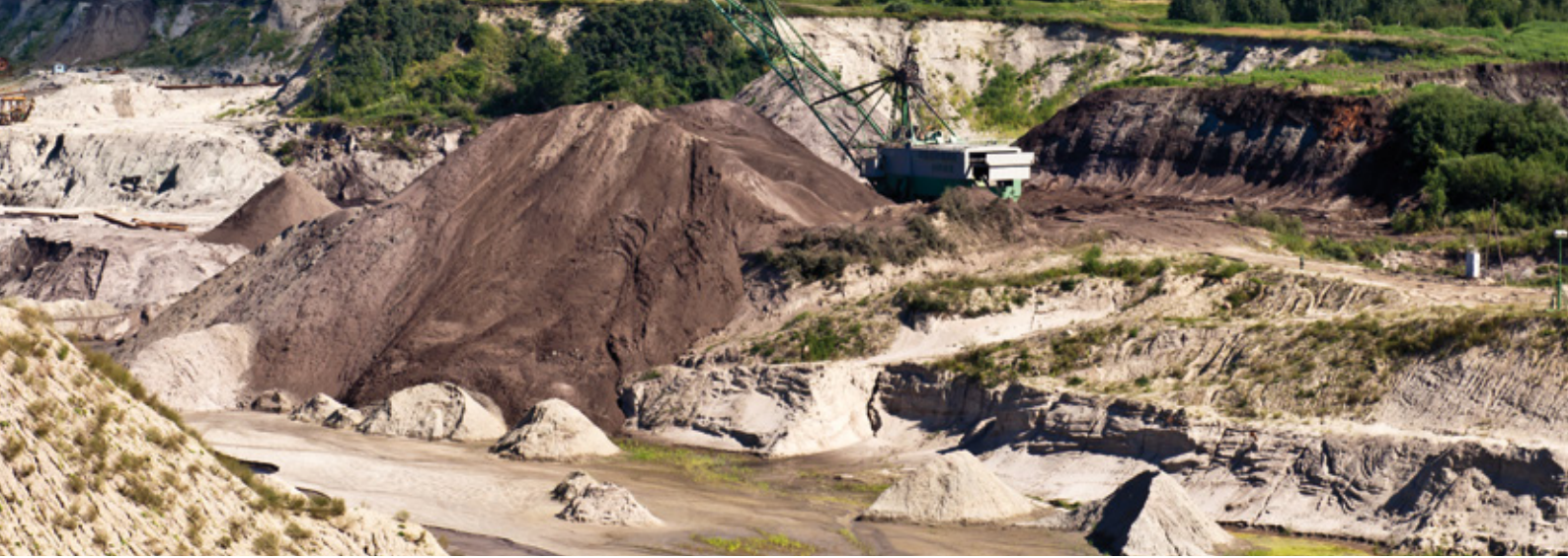
Tagebau in Russland