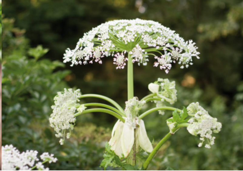
Riesenbärenklau, ursprünglich aus dem Kaukasus

land mindestens auf dem vorgefundenen Niveau der Verbreitung und Ausprägung erhalten bleiben.